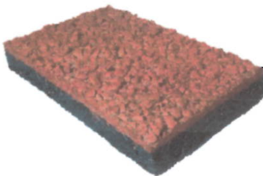
Brinquedos com acesso até 1m

Auto extingüível Monolítico Resiliência Certificação do Corpo de Bombeiros Atende as Normas 16071 e 15075